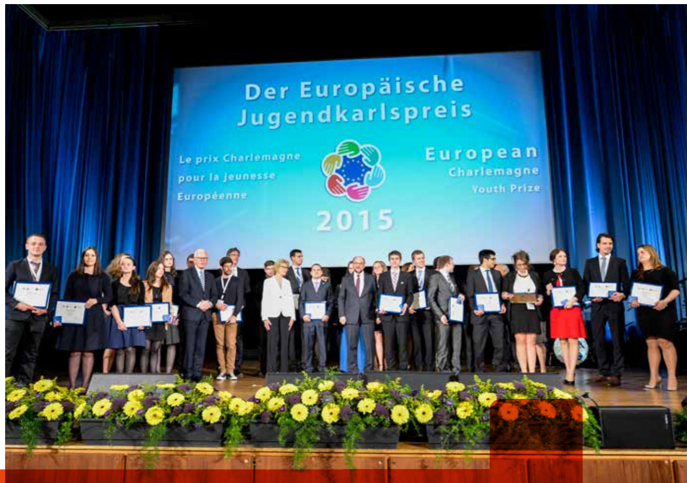
Youth Prize

“The students of the Master in European Contemporary History at the University of Luxembourg successfully bring history to life and illustrate it. [...] They manage to make us comprehend the history of the 20th century through the communications technology of the 21st century.”