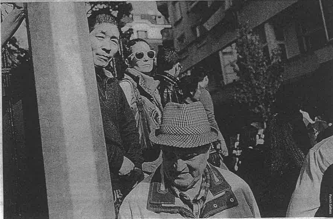
À mesure qu'ils vieillissent, les individus ont tendance à perpétuer les idées anciennes

La Figure 2 illustre ce phénomène dans le cas du Japon. Elle montre notamment la corrélation en forme de U inversé entre l'OADR et les demandes de brevets par tranche de 100 000 habitants au Japon. Chaque point correspond à un an, tandis que l'intervalle de temps s'étend de 1964 à 2010. Comme le suggère le graphique, le ratio associé au nombre de brevets le plus élevé est d'environ 26 pour cent (soit 26 personnes âgées de plus de 65 ans) par rap-